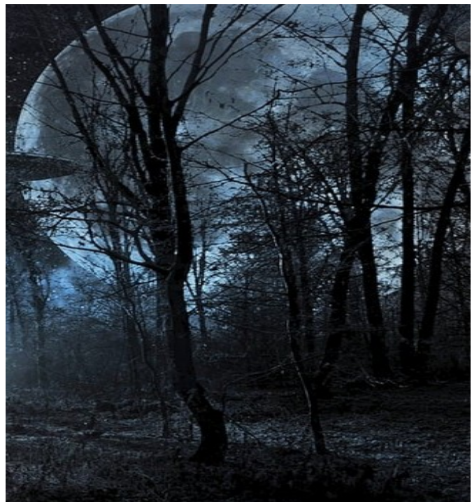
Der Vollmond ist des Jägers Freund