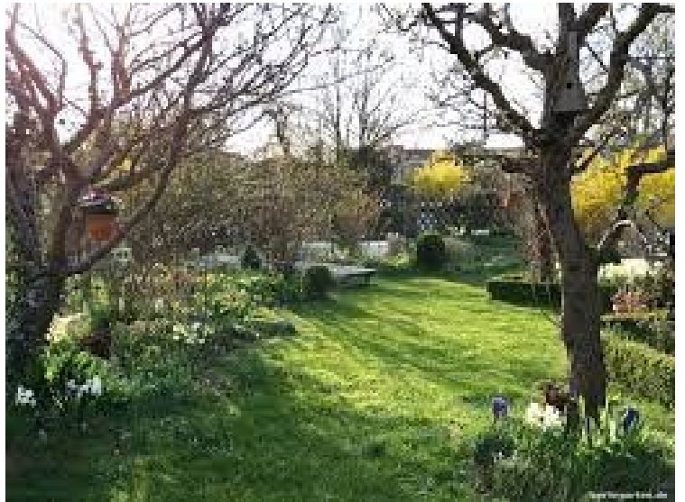
Erste Blumen blühen im März

Die Natur erwacht zum Leben, alles will zur Sonne streben. Auch wenn's des Nachts noch friert, am Tage schon die Sonn' regiert.