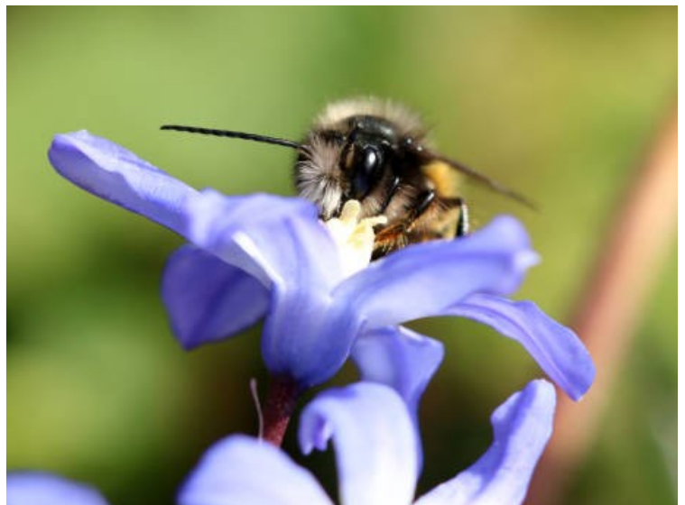
Hummel auf einer Blüte