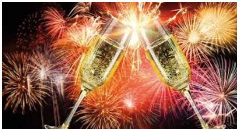
Sylvester: Ein Prosit auf das neue Jahr!

Glauben und Hoffen an das Gute, rein ins Jahr mit frischem Mute. Ich wünsch viel Glück für´s neue Jahr, das eure Wünsche werden war!