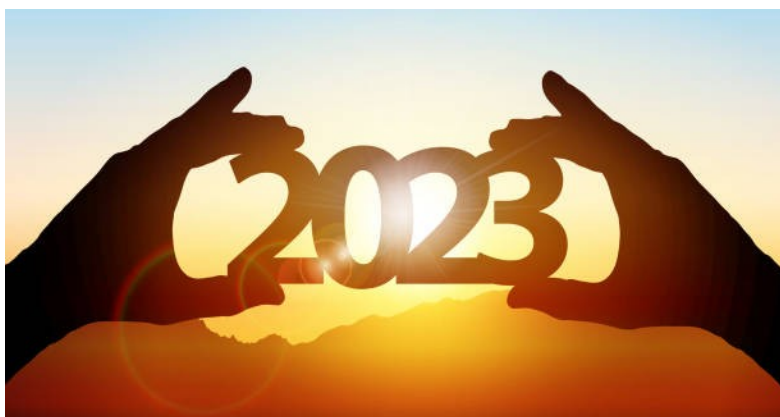
Was wird uns das neue Jahr wohl bringen?