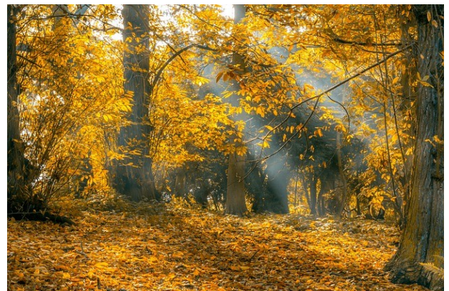
Der Herbst taucht alles in goldenes Licht