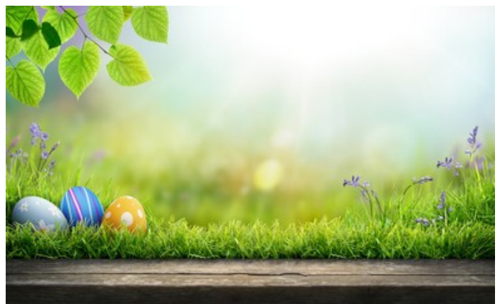
Ostereier im Moos