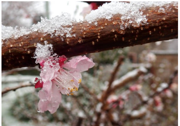
Blüte im Schnee

So ist das Wetter seit eh und je, Ostereier lagen schon oft im Schnee. Nur einer kann machen was er will, der Ostermonat - der April.