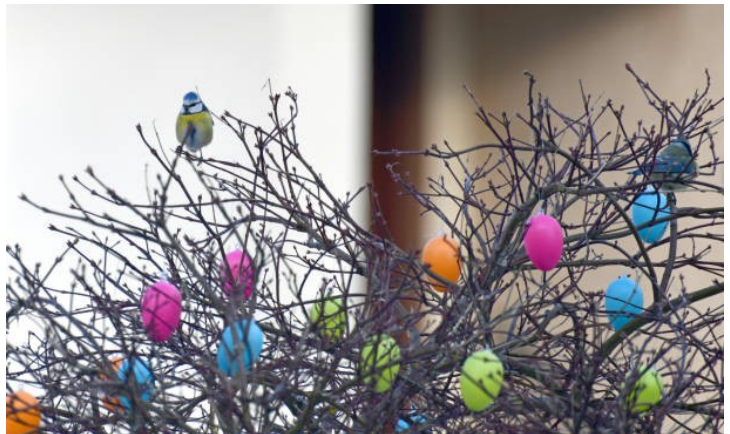
Blaumeise im Ostereier-Baum